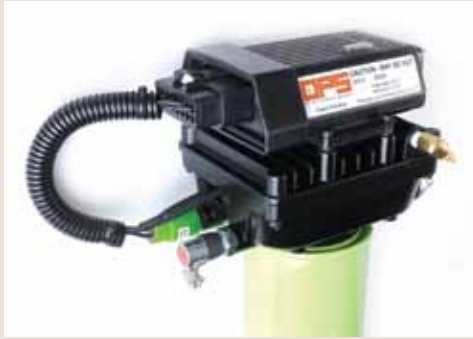
Unidad de control electrónico de Eco-Pur™