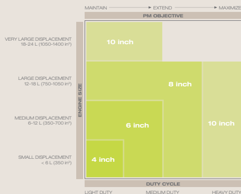
Escalable de selección de filtro